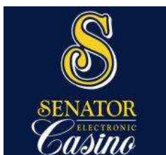
Adria Casino d.o.o.