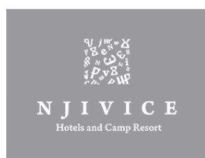
Hoteli Njivice d.o.o.